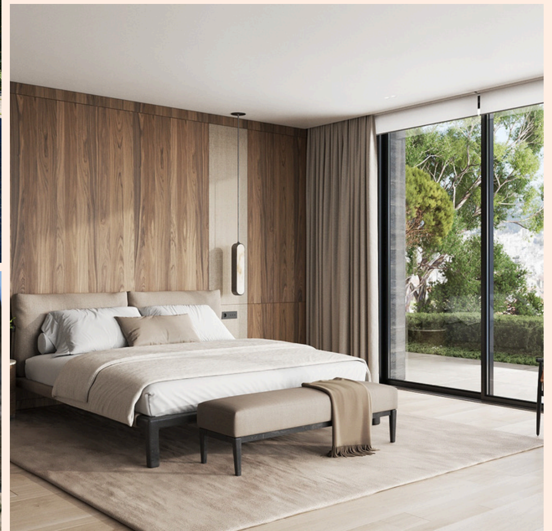
Villa Capraia Saint-Jean-Cap-Ferrat, France